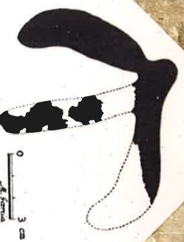
Fig. 11. Figura del abrigo de Cuevas de Panoría.